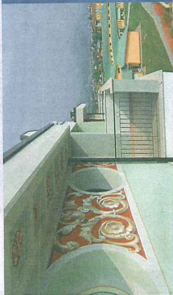
I SERVIZI SONO IL PLUS

Tutta la famiglia potrà raggiungere con la pista ciclabile il centro sportivo comunale con la piscina coperta (tre vasche, sauna, bagno turco e caffetteria), la palestra polifunzionale, il calcetto coperto, la palestra fitness e un campo di calcio con pista di atletica, organizzati da una Polisportiva con più di 4.000 iscritti, paradiso dell'aggregazione.